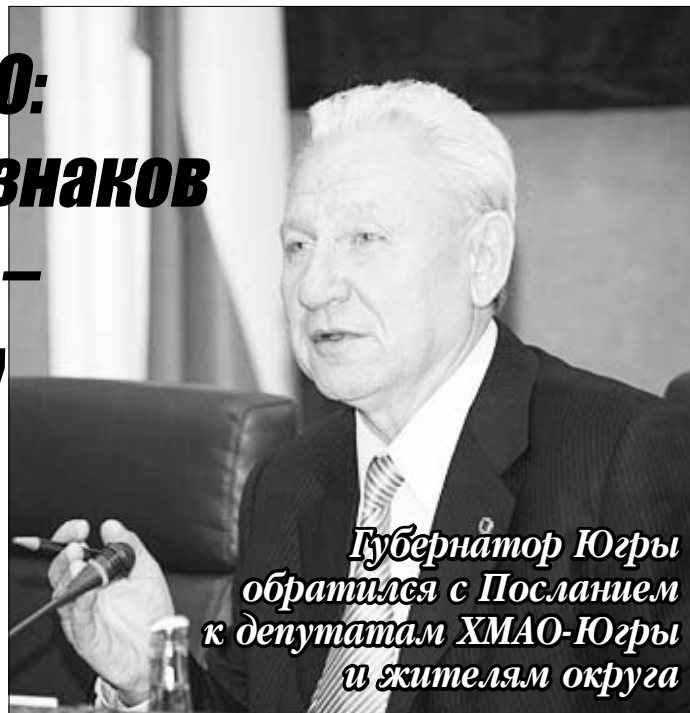
Губернатор Югры обратился с Посланием к депутатам ХМАО-Югры и жителям округа

Дорогое топливо, дорогие товары, дорогие билеты на транспорт – серьезные удары по семейному бюджету.