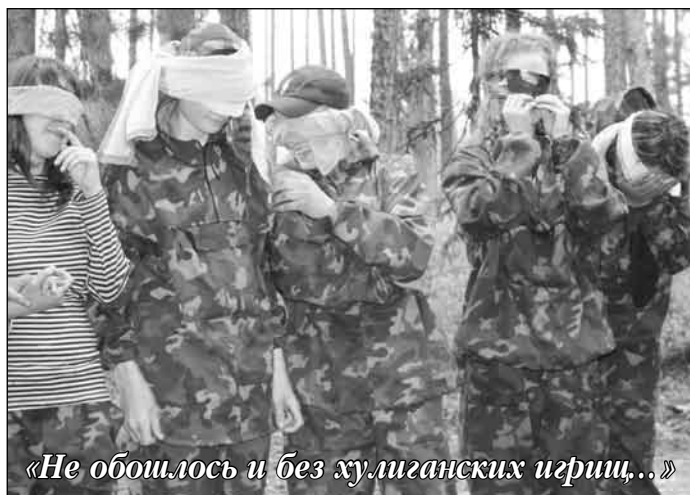
«Не обошлось и без хулиганских игр...»