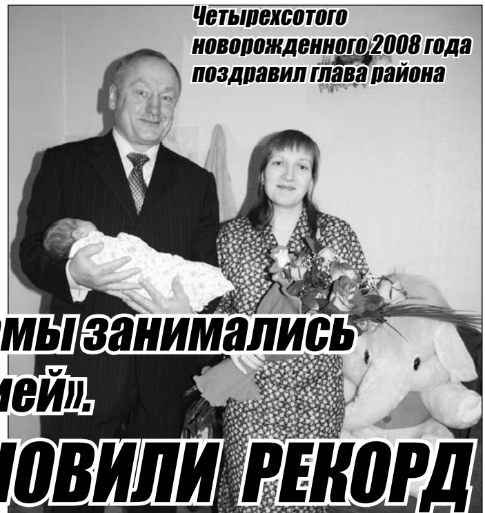
Четырехсотого новорожденного 2008 года поздравил глава района