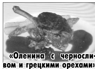
«Оленина с черносливом и грецкими орехами»

Предлагаю несколько рецептов приготовления блюд из мяса оленей. Я надеюсь, что тем, кто их попробует, понравится.