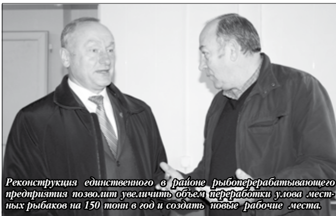
Реконструкция единственного в районе рыбоперерабатывающего предприятия позволит увеличить объем переработки улова местных рыбаков на 150 тонн в год и создать новые рабочие места.