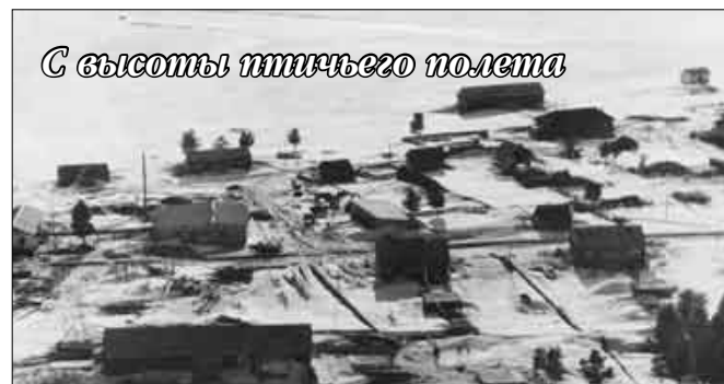
С высоты птичьего полета