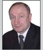
Сергей МАНЕНКОВ, глава Белоярского района: «НАШЕ СЕРЕБРО ДОРОЖЕ ЗОЛОТА»